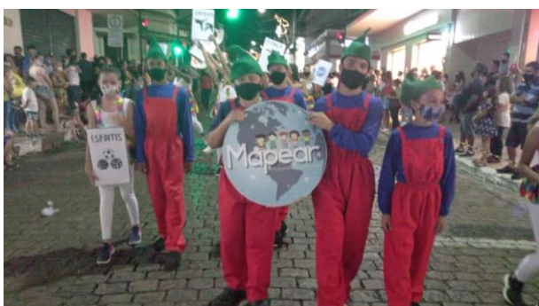
DESFILE –PARADA DE NATAL