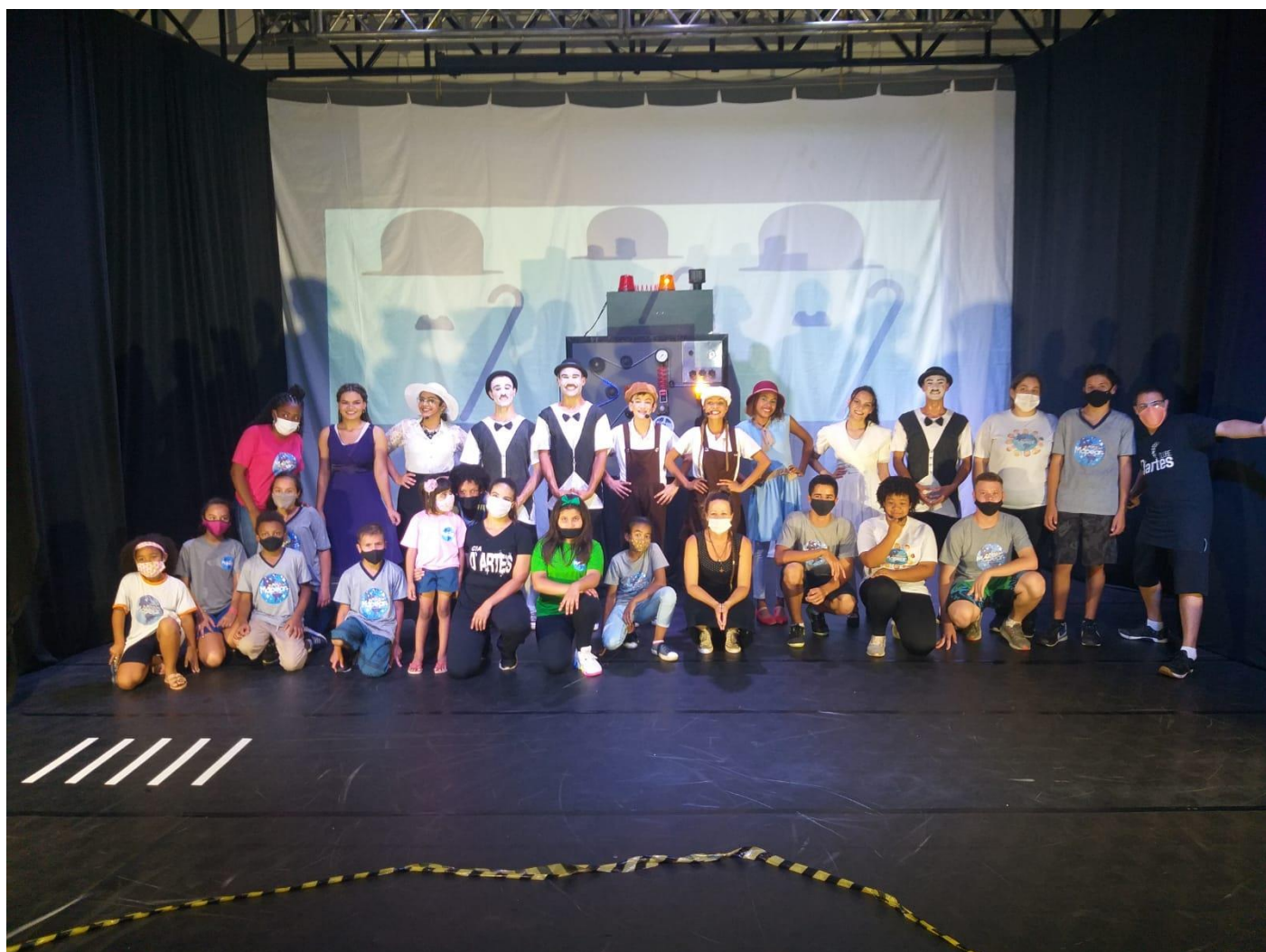
APRESENTAÇÃO NO TARTARUGÃO COM O DARTES.