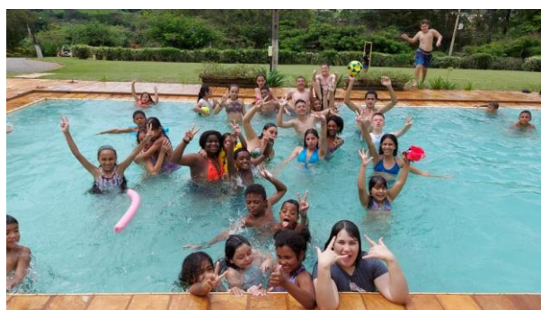
DIA DE LAZER E CONFRATERNIZAÇÃO NA CHÁCARA CANAÃ